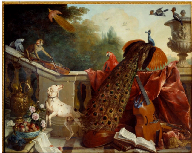
Animaux, fleurs et fruits François Desportes (1661-1743)